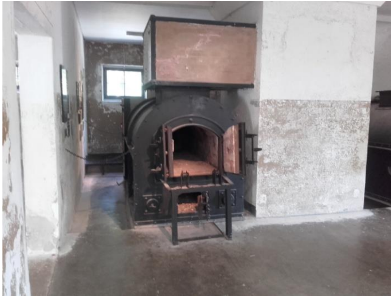
Krematorium i Dora-Mittelbau

Under min kørsel rundt i Harzen mødte jeg en reklame for Harzer Bike-Smiede.