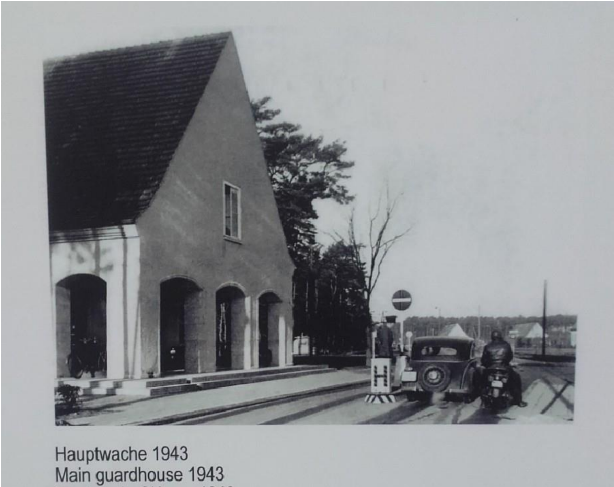
Peenemünde hovedvagt 1943