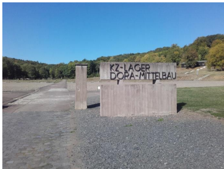
KZ lejr Dora-Mittelbau

Dora-Mittelbau var klar til at starte produktionen af V2 raketter i marts 1944. Raketterne blev dog aldrig det taktiske våben, man havde håbet på. I praksis ramte man ligesom vinden blæste, så det blev mere et terror våben end noget af taktisk betydning. Krigslykken begyndte også at vende. Det er et faktum, at etablering af produktionsfaciliteter og produktion af raketterne krævede flere menneskeliv end det antal mennesker, der blev dræbt, når områder blev ramt af V2 raketterne. I alt mistede ca. 20.000 mennesker livet i forbindelse med produktionen af raketterne. Ca. 10.000 mennesker blev dræbt af raketterne.