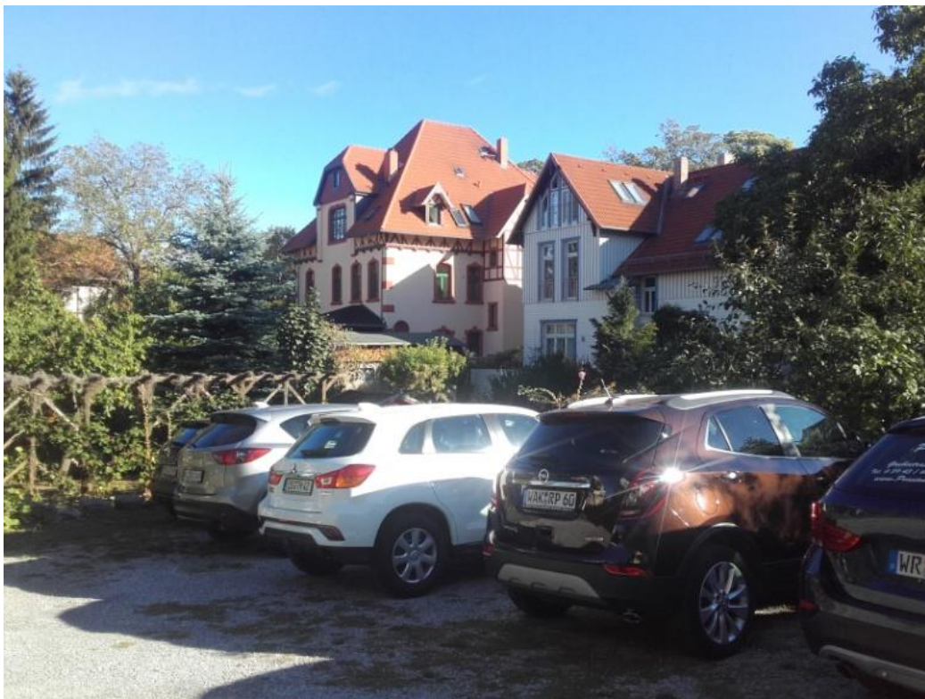
Udsigt fra mit logi i Wernigerode

Man fornemmer tydeligt velstanden gennem tiderne, når man betragter husene i den gamle bydel Altstadt.