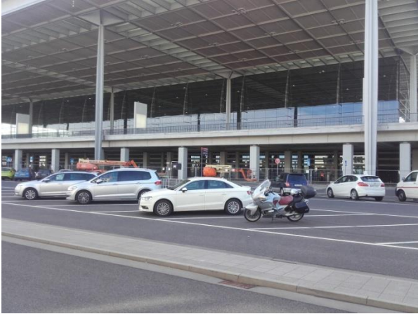
Berlin Brandenburg Airport Terminal 1

Da der ikke var meget at se her, kørte jeg videre langs de enorme parkeringspladser. Her skete der så til gengæld noget. Enormt store pladser var proppet med VW biler. Da der normalt plejer at være leveringstid på en ny VW må alle disse biler være nogle, der er taget retur, eller som man ikke tør levere pga. dieselskandalen. Så måske har man rent faktisk samlet hele to skandaler her!