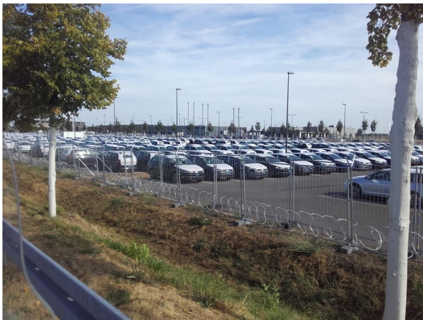
Parkeringsplads Berlin Brandenburg, fyldt med nye VW biler

Da der ikke var meget at se her, kørte jeg videre langs de enorme parkeringspladser. Her skete der så til gengæld noget. Enormt store pladser var proppet med VW biler. Da der normalt plejer at være leveringstid på en ny VW må alle disse biler være nogle, der er taget retur, eller som man ikke tør levere pga. dieselskandalen. Så måske har man rent faktisk samlet hele to skandaler her!