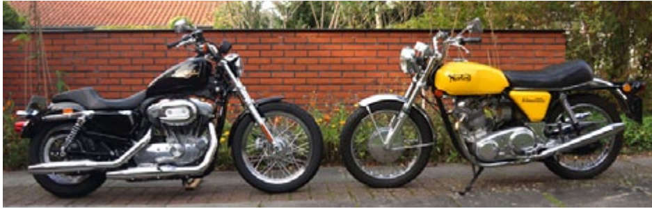
Læs Steens fine sammenligning af disse 2 herlige maskiner