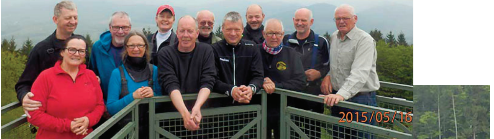
Og herunder er så Fossiler i Sauerland - først på stropetour i bakkerne og selvfølgelig - på et bryggeri !!