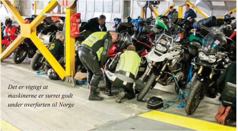
Det er vigtigt at maskinerne er surret godt under overfarten til Norge