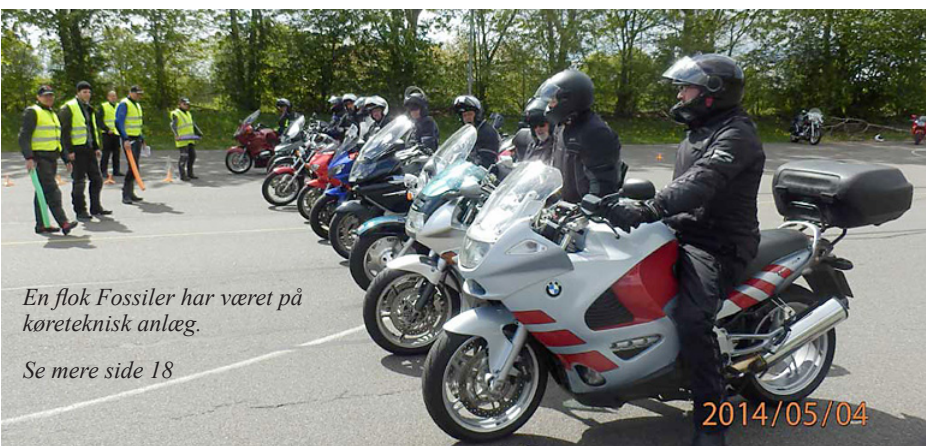
En flok Fossiler har været på køreteknisk anlæg.