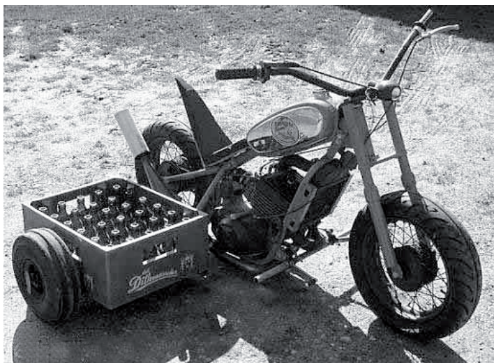
Smart lille ting til næste træf?