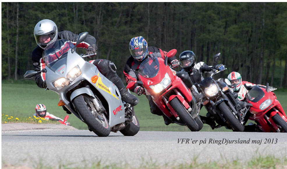
VFR'er på RingDjursland maj 2013

Køreteknisk kursus på Ring Djursland i maj måned