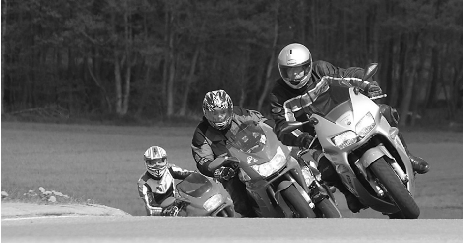
Foto her, og på bladets forside, er fra sidste års kursus