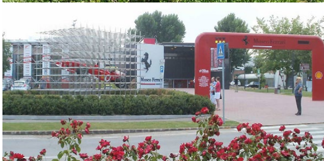
Lidt flere motiver fra Toscana-turen 2013