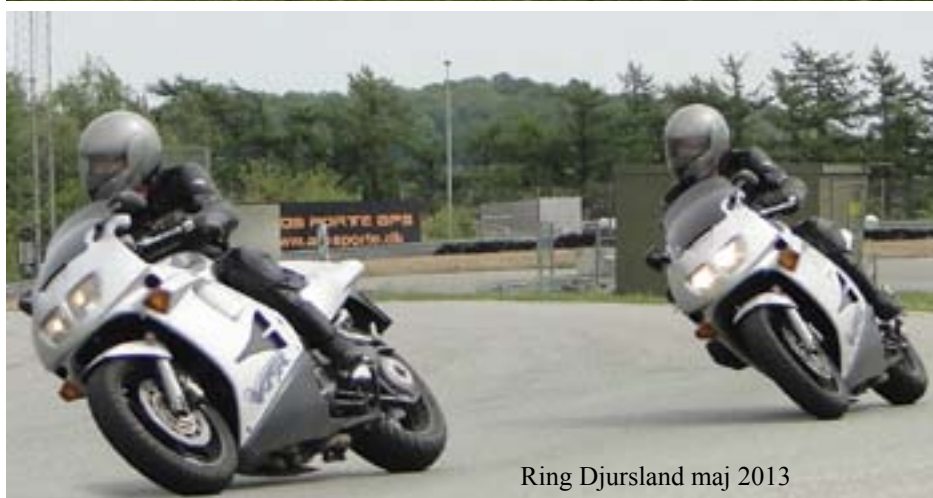
Ring Djursland maj 2013