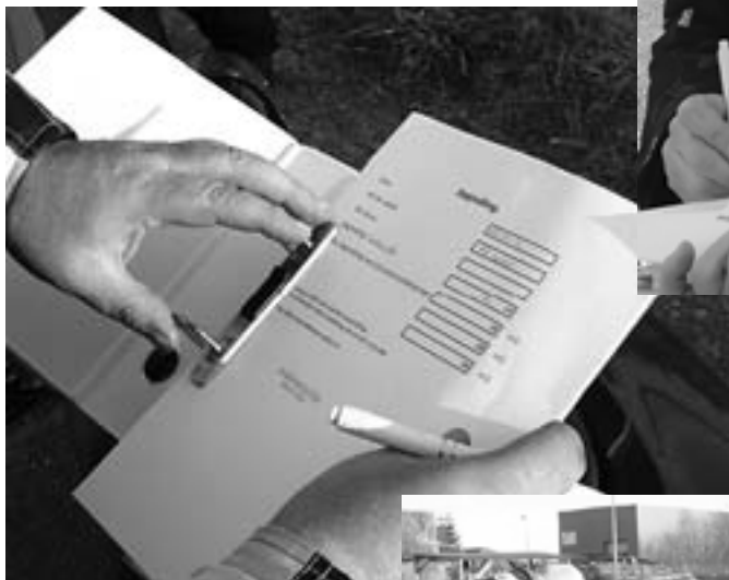
Txt og foto: RedakSøren

Lyden målte Hans i en afstand af 50 cm bag potten i en 45graders vinkel. 3 målinger på hver mc, og resultaterne blev noteret af Finn og KajVerner.