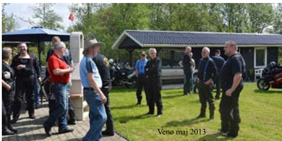
Venø maj 2013