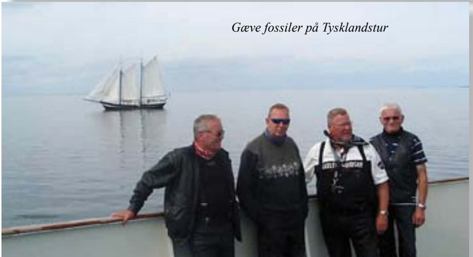
Gæve fossiler på Tysklandstur