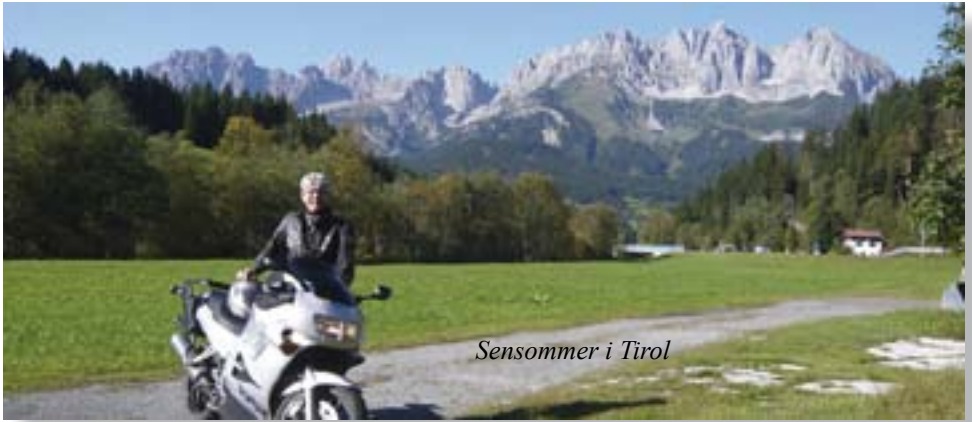
Sensommer i Tirol