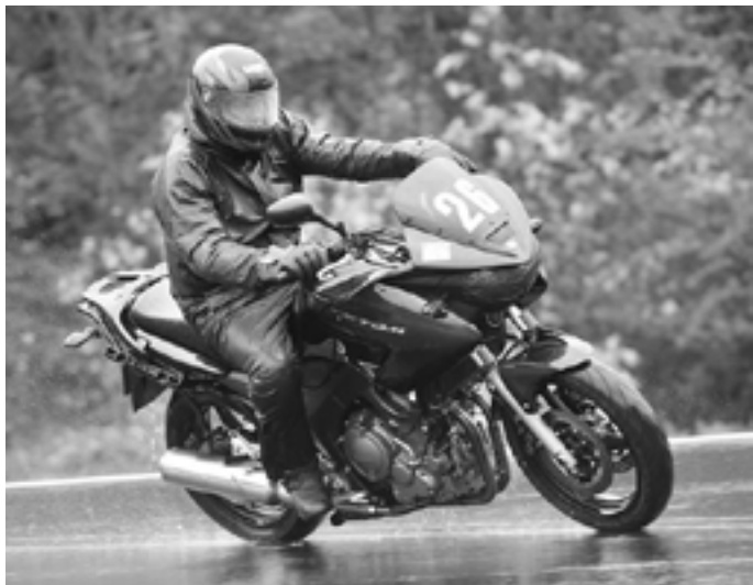
Bondemanden på Ring Knutstorp på TDM'en

jumpe. Årgangen 1974 var som et næsehorn, når den er kommet op i fart kan den ikke stoppe. Årgang 2005 bremsere på Yamaha er noget helt andet. Men den styrede den selv, jeg var flere gange ved at køre galt i rundkørslerne!