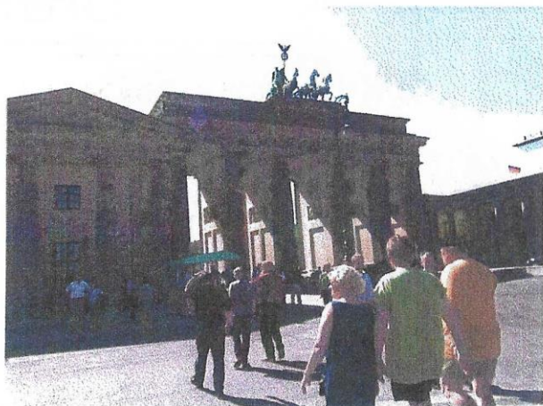
Fossiler ved Brandenburger Tor.

En lille sejltur med en kædetrukken færge, det var umuligt at opdrive en med kardan..og så var temperaturen i øvrigt 30 gr.